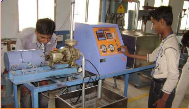
ઇન્સ્ટ્રુમેન્ટ મીકેનીક લેબ