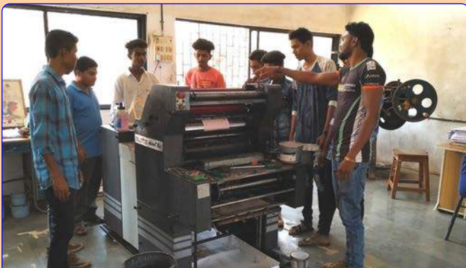
ઓફસેટ પ્રિન્ટીંગ લેબ