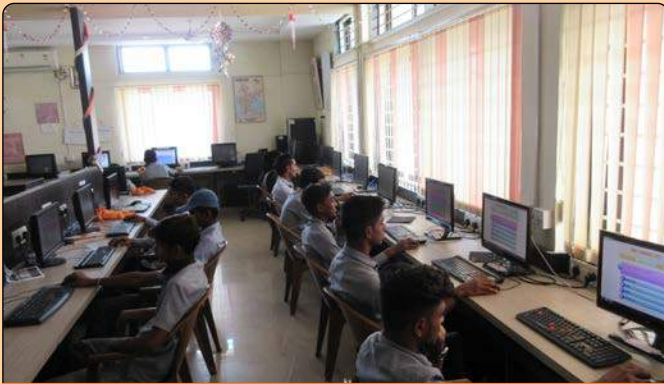
સોફ્ટવેર પ્રોગ્રામીંગ લેબ