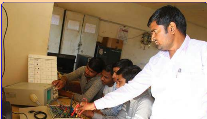
ઇલેક્ટ્રોનિક્સ મીકેનિક લેબ