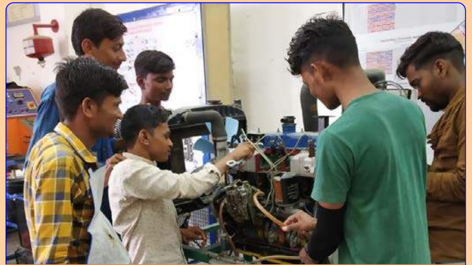
મીકેનિક ડીઝલ લેબ