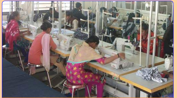
સુઈંગ ટેકનોલોજી લેબ