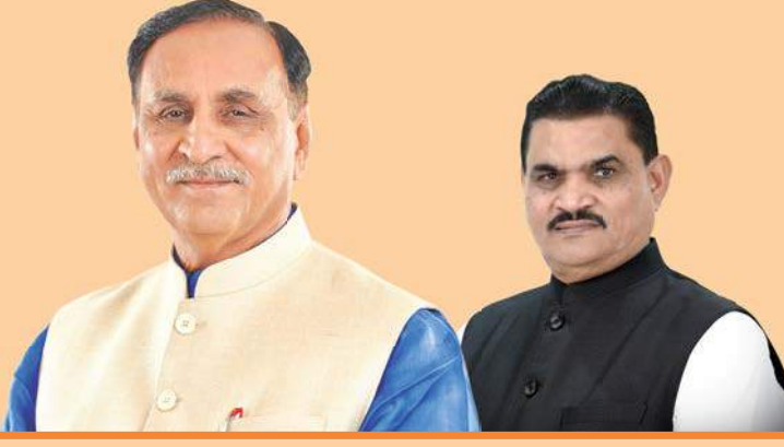
વિજય રૂપાણી મુખ્યમંત્રીશ્રી, ગુજરાત રાજ્ય