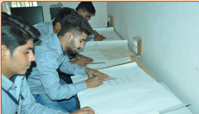
ડ્રાફ્ટ્સમેન સિવિલ લેબ