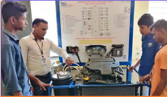
મીકેનીક મોટર વ્હીકલ લેબ