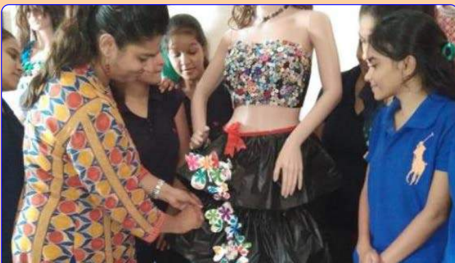
ફેશન ડિઝાઈન લેબ